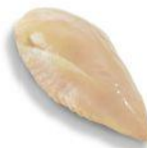
Das Bild entspricht nicht dem Originalzustand und der Verpackung.