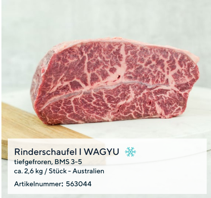
Rinderschaukel | WAGYU ❄️ tiefgefroren, BMS 3-5 ca. 2,6 kg / Stück - Australien Artikelnummer: 563044