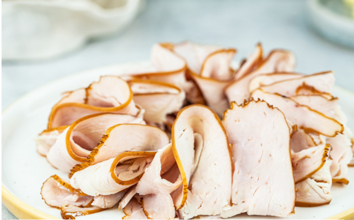
geräucherte Putenbrust | GUT HESTERBERG geschnitten 500 g / Päckchen - Brandenburg Artikelnummer: 543515