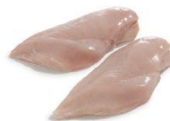
Das Bild entspricht nicht dem Originalzustand und der Verpackung.